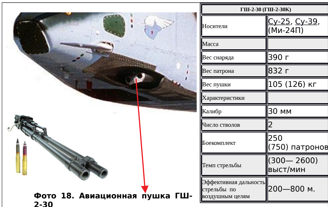
Фото 18. Авиационная пушка ГШ-2-30

Кроме того Су-25 может нести контейнеры СППУ-22 с двухствольной 23-мм пушкой ГШ-23Л.