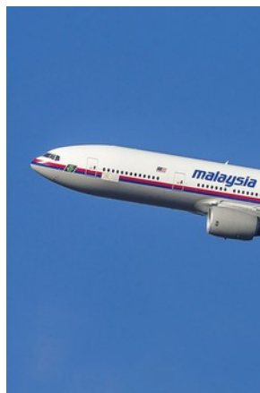
Фото 7. Boeing 777

Исходными данными для анализа данной ситуации являются: технические данные самолета Boeing 777; маршрут его следования; высота и скорость полета; изменение курса относительно первоначально заданного; место падения самолета, фотографии и видеоматериалы остатков самолета, описание радиуса и характера разброса обломков.