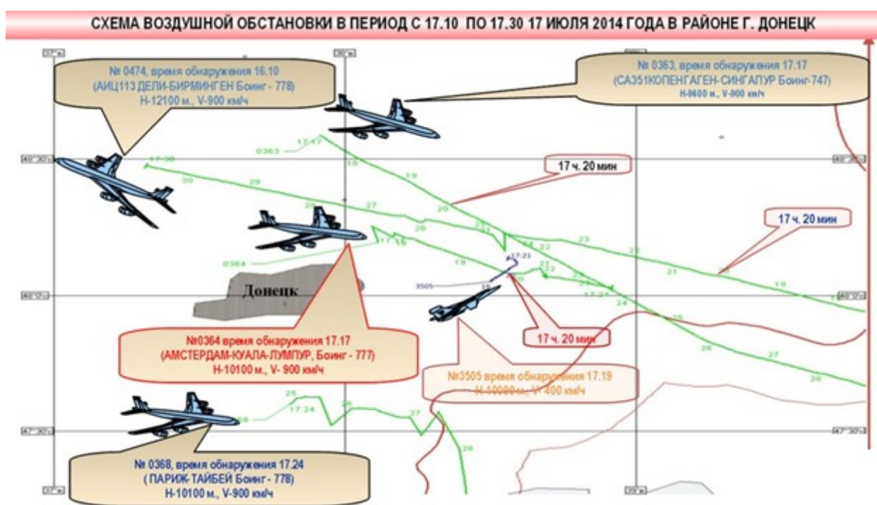
Рис.1 Схема воздушной обстановки в районе гибели Boeing 777 (по данным МО РФ)

Кроме того, российскими средствами контроля воздушной обстановки зафиксирован набор высоты самолетом украинских ВВС, предположительно Су-25, в направлении малазийского Boeing 777. Удаление самолета Су-25 от Boeing 777 составило от 3 до 5 км.