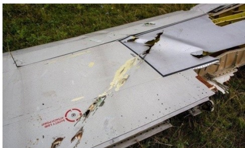
Фото 1. Фрагмент плоскости Boeing 777

Более полную картину причин гибели Boeing 777 может дать детальный анализ его обломков. При рассмотрении фотографий фрагментов самолета, представленных в Интернете, можно увидеть различные повреждения его обшивки – разрывы и разломы, отверстия с загибами на внешнюю и на внутреннюю стороны фюзеляжа, что говорит о мощном внешнем воздействии на самолет.