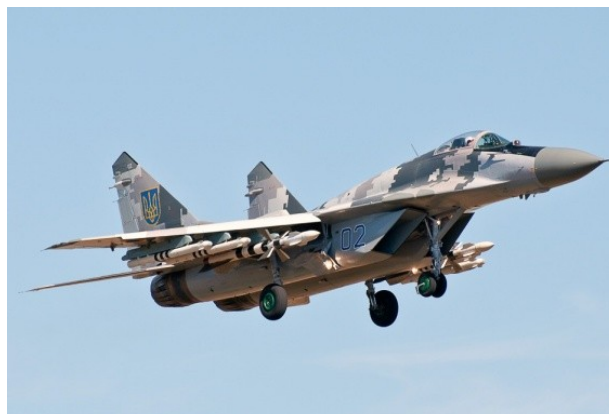
Фото 14. МиГ-29