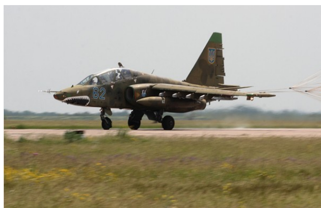
Фото 15. Су-25

Также по данным Минобороны России, российскими средствами контроля воздушной обстановки 17 июля был зафиксирован набор высоты самолетом украинских ВВС , предположительно, Су-25 в направлении малайзийского Boeing 777. Расстояние между двумя самолетами не превышало 3–4 километров.