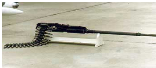
Фото 17. Авиационная пушка ГШ-301

МиГ-29 оборудован пушкой ГШ-301 калибра 30 миллиметров, со скорострельностью 1500 выстрелов в минуту. Эта пушка заряжена 150 снарядами, содержащими вольфрамовый сплав. Эффективная дальность стрельбы из нее по воздушным целям составляет 200—800 м, по наземным целям — 1200—1800 м. Такие снаряды проходят насквозь, оставляя следы совершенно круглой формы, они не взрываются внутри кабины, не являются зажигательными, но могут убить экипаж и произвести разрушение кабины, что характерно для конфигурации входных и выходных отверстий: входные отверстия – краями внутрь, выходные – на противоположной стенке – краями наружу.