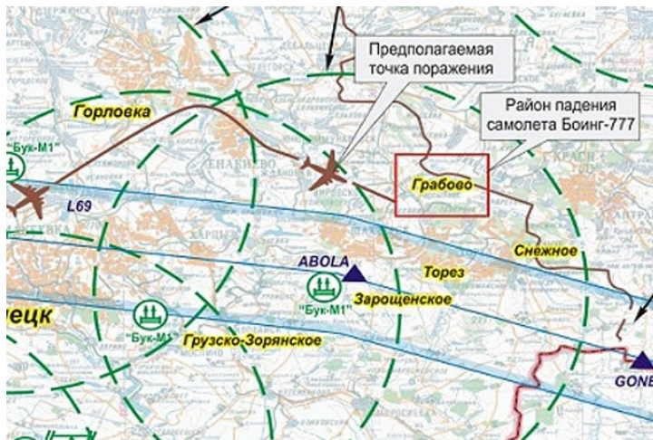
Рис.2. Группировка украинских ЗРК

Группировка украинских войск 17 июля в районе гибели самолета насчитывала 3–4 установки «БУК-М1». Об этом заявили в российском министерстве обороны. Начальник главного оперативного управления Генштаба генерал-лейтенант Андрей Картополов подчеркнул, что российская сторона располагает снимками из космоса отдельных мест дислокации подразделений украинской армии на юго-востоке Украины , в частности, «Буков» в 8 км от Луганска. А утром в день гибели малайзийского лайнера российские средства контроля обнаружили батарею ЗРК «Бук-М1»