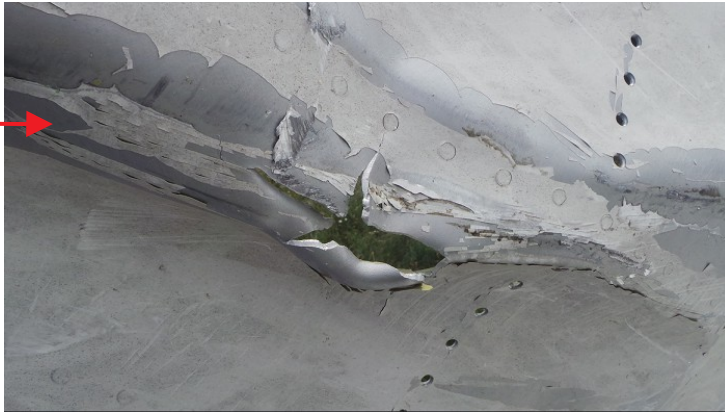
Фото 22. Характер повреждений обшивки Boeing 777