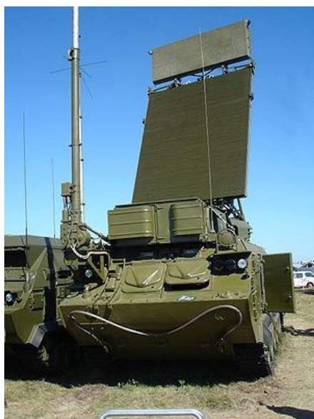
Фото 9. РЛС 9С18М1 «Купол»

6.1.2. Так же Минобороны России заявило о том, что российскими военными зафиксирована работа РЛС украинской батареи ЗРК «Бук-М1» в день гибели малайзийского Boeing 777. Станция обнаружения и целеуказания (СОЦ) 9С18 «Купол» является трехкоординатной когерентно-импульсной станцией обнаружения и целеуказания для передачи информации о воздушной обстановке на командный пункт 9С470 ЗРК 9К37 «Бук» . СОЦ 9С18 способна обнаруживать и опознавать воздушные объекты на расстоянии до 110–160 км, дальность опознавания низколетящих целей (до 30 м) составляет до 45 км. Такая РЛС могла использоваться для обнаружения и сопровождения Boeing 777.