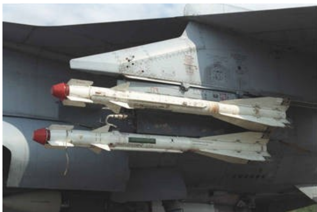
Фото 16. Ракеты Р-60М на внешней подвеске самолета

На вооружении как МиГ-29 так и Су-25 могут находиться УР ближнего боя Р-60М.