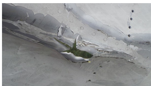
Фото 4. Фрагмент фюзеляжа Boeing 777