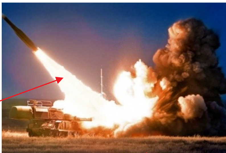
Фото 10. Старт зенитной ракеты ЗРК «Бук М-1»

След от нее уходит в облака и держится в воздухе до 10 минут. Звук, вызываемый стартом ракеты слышен в радиусе 7—10 км от стартовой площадки.