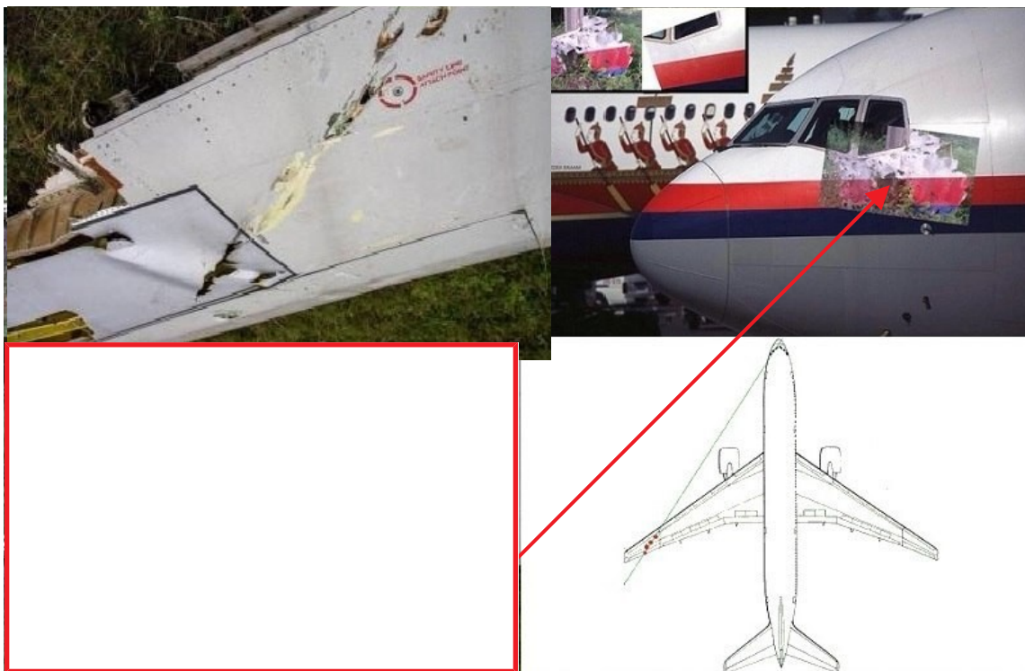
Фото 20. Характер повреждений кабины Boeing 777

Картина входных и выходных отверстий в области кокпита (кабина пилотов) Boeing 777 полностью соответствует прохождению на вылет снарядов калибра примерно 20—30 мм от пушечного вооружения военного самолета. Это подтверждает вторую версию гибели Boeing. Об этом же говорит и характер рассеивания пробоин по поверхности самолета. Края фрагмента фюзеляжа кабины пилотов с левой стороны завернуты от внутренней стороны к внешней, это указывает на значительные разрушения, которые произошли внутри кабины в результате динамического воздействия снарядов на ее правую сторону.