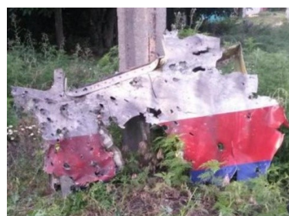
Фото 6. Фрагмент кабины Boeing 777

Обращают на себя внимание отверстия с загибами внутрь фюзеляжа, это отверстия округлой формы, как правило, сгруппированные. Такие отверстия могли быть образованы только круглыми в сечении металлическими элементами, возможно, стержнями или снарядами авиационной пушки. Возникает вопрос: кто и каким способом мог доставить к самолету такие элементы, и что они могли из себя представлять?