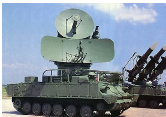
Фото 8. ЗРК 9К37М1 «Бук-М1»