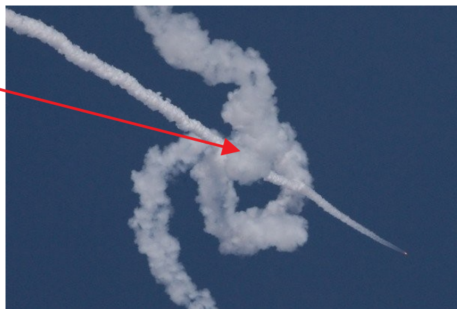
Фото 12. Поражение воздушной цели ракетой ЗРК «Бук-М1»

в) Подрыв боевой части имеет характерную конфигурацию, что может быть видно с земли при ясной погоде.