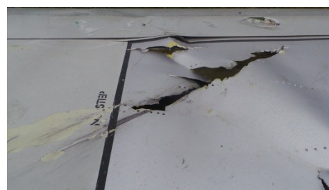
Фото 4. Фрагмент плоскости Boeing 777