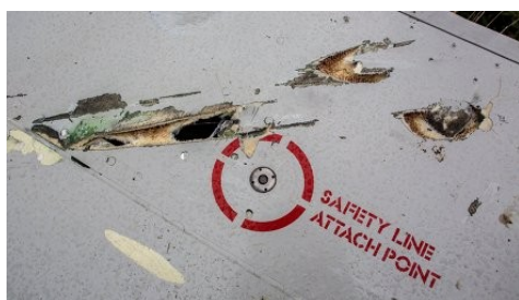
Фото 3. Фрагмент плоскости Boeing 777